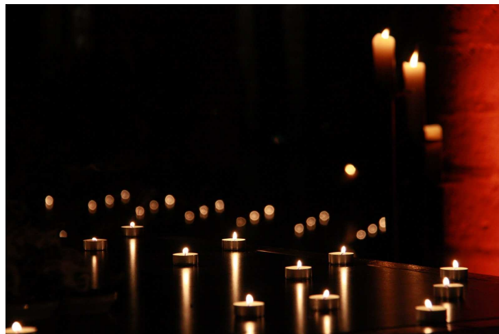
Samedi 11 décembre 2010, église Saint-Maurice